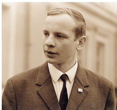
Б. Я. Аншаков

6 ноября в музее состоялся вечер памяти легендарной личности в истории музея – Бориса Яковлевича Аншакова. Коллеги, друзья, родные Аншакова, молодое поколение музейщиков перенесли в благодатное время его жизни и работы. Был подготовлен документальный фильм, в который вошли воспоминания близких, а также уникальные кадры киноплёнки – запись выступления Б. Я. Аншакова на заседании, посвящённом 85-летию Клинского Дома-музея П. И. Чайковского (1980 г.).